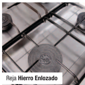
Reja Hierro Enlozado